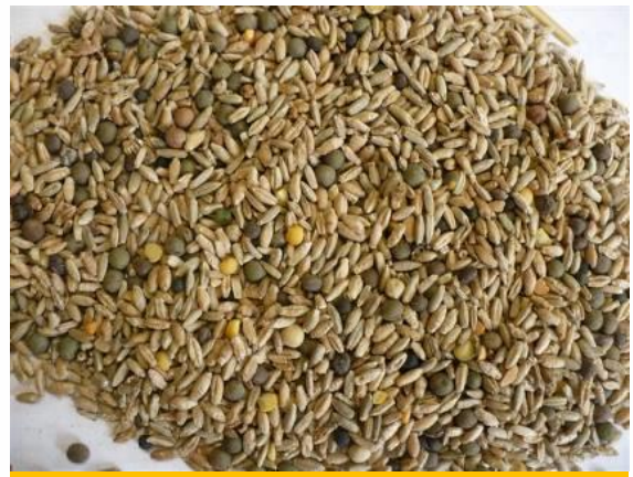
Mélange triticales seigle pois vesce, avec 25% de protéagineux