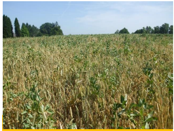
Seuls des mélanges complexes sont conseillés, plus stables qu'un mélange simple

On se cale sur la maturité des protéagineux pour déclencher le chantier, l'objectif étant de produire de la protéine. Le taux d'humidité à atteindre est de 15% pour un stockage optimum.