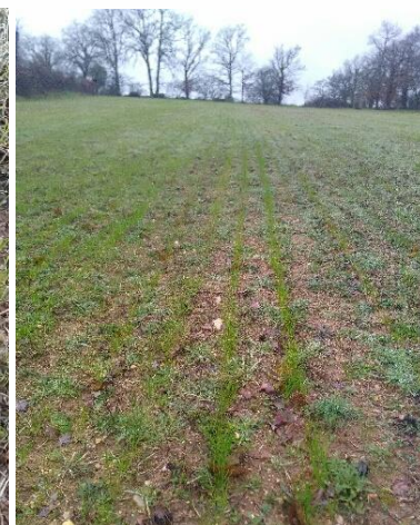
Combiné semis à dents (15/10/20) Semis J+55 jours (10/12/2020) Semis J+90 jours (25/01/2021)

Cette méthode me satisfait également car je n'aime pas trop le matériel : elle permet un travail simplifié du sol, donc un gain de temps, et une diminution de la consommation d'énergie, c'est meilleur pour la planète ! Avant j'installais mes prairies avec 2 passages de covercrop, pour détruire la pelouse, 1 passage pour le semis et 1 passage pour le rouleau, soit 4 passages/ha. Désormais je ne fais que 2 passages/ha (combiné et rouleau). Le combiné est loué à un concessionnaire situé à 25 km pour un coût de 18 € HT/ha, et je sème au minimum 2 ha/heure (à 7 à 8 km/h). Hors main-d'œuvre, le coût est estimé à 221 €/ha (186 € de semence et 35 € de mécanisation et transport). Malgré le temps pour aller le chercher et le rapporter, le bilan gain/contrainte est largement positif.